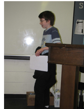
Advocaat van de overheid